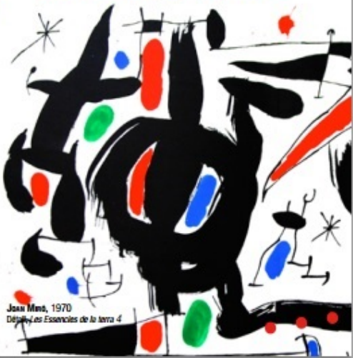
Joan Miró, 1970 Des Essences de la terre 4

LA PERMANENCE DE LA GRAVURE DE PICASSO À NOS JOURS Une histoire des arts graphiques : 3 e partie 24 mai - 2 novembre 2014