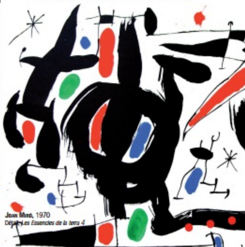
Joan Miró, 1970 Départ Les Essences de la terre 4